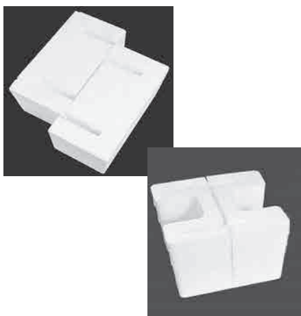
スラブ貫通用 Hタイプ