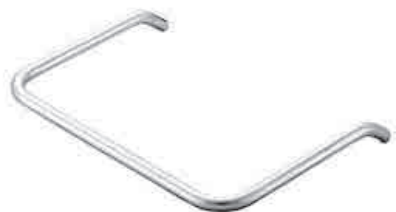
ステンレス タラップ