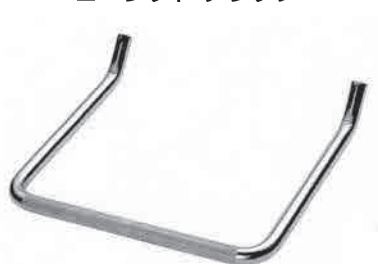
ローレット タラップ