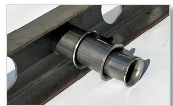
テンプレート使用時