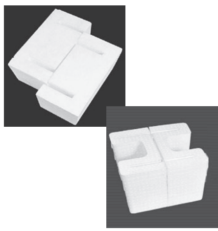
スラブ貫通用 Hタイプ